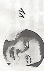
Mira Mihelič 1912-1985 Pisateljica 19/10