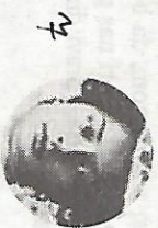
Lili Novy 1885-1958 Pesnica in prevajalka poezije 19/12