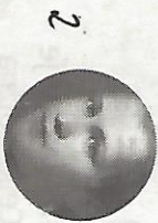
Josipina Turnograjska 1833-1854 Prva slovenska pisateljica 19/1