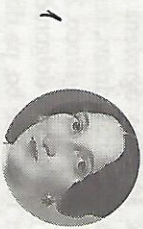
Luiza Pesjak 1828-1898 Pisateljica 19/1