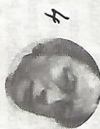
Ivana Kobilica 1861-1926 Silkarka 19/7