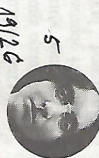
Zofka Kveder 1878-1926 Pisateljica, prva uvrščena v nacionalno zbirko Zbrana dela slovenskih pesnikov in pisateljev 19/26